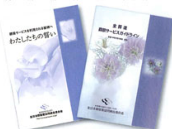
消費者向け葬祭サービスガイドライン 〈わたしたちの誓い〉

二〇〇七年五月のことです。ここには、顧客情報の守秘義務、説明責任、料金体系の明確化、見積書交付の義